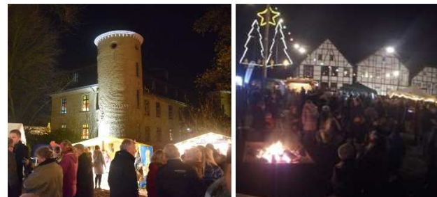
Am Wochenende des 2. Advents findet wieder die traditionelle Schlossweihnacht rund um das Schloss Horneburg statt