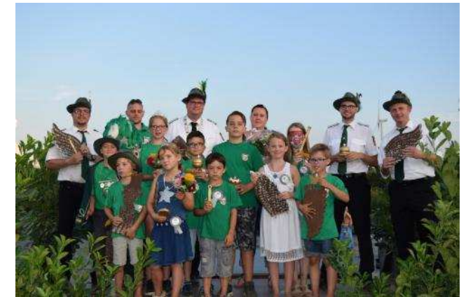
Majestäten und Insignienträger des Kinderschützenfestes 2016 sowie des Schießens um den Tageskönig